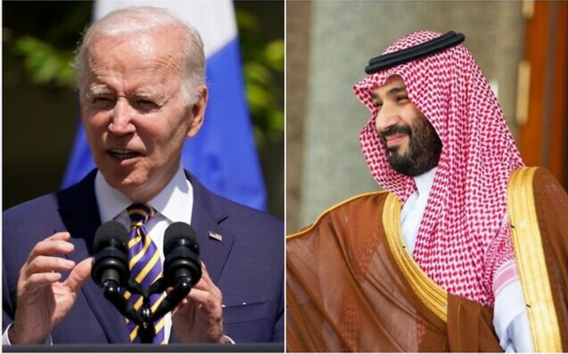
美國總統喬·拜登和沙烏地王子穆罕默德·本·薩勒曼。

總統試圖淡化 GCC+3 高峰會在沙烏地阿拉伯舉行的事實，因為他在競選期間曾承諾在人權方面將沙烏地阿拉伯視為「被放逐的國家」(pariah)。