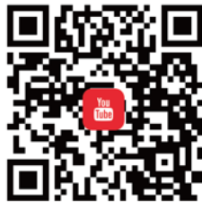
CANWF YouTube 觀看最新影音新聞、今日以色列影片