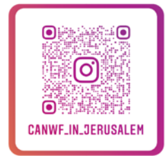
CANWF Instagram 以色列生活大小事、 節日卡片、經文圖與您分享