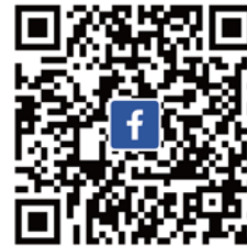
CANWF Facebook 不錯過即時消息與影片