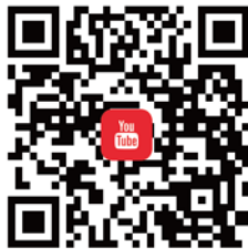
CANWF YouTube 觀看最新影音新聞、今日以色列影片