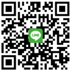
CANWF Line@ 每週以色列新聞及代禱消息