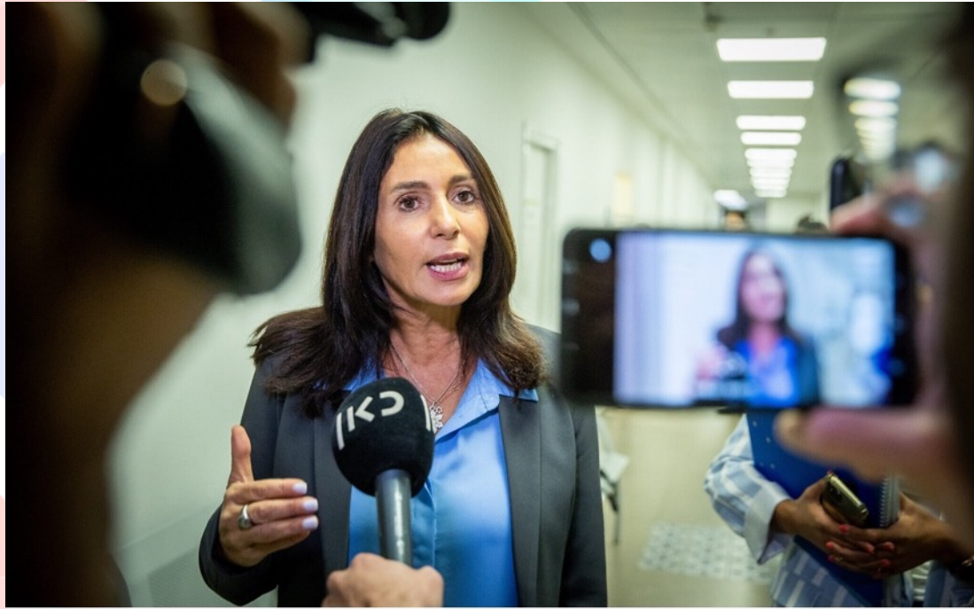
2022年5月24日，以色列聯合黨議員雷格夫（Miri Regev）。

當以色列聯合黨議員米利暗·雷格夫（Miri Regev）在上週聯合黨派系會議中，在不知情或不在意的情況下被錄音，讓這一連串政治戲碼來到了低點。她宣稱，如果要將這個令人生厭、明顯危機四伏的聯合政府趕下台，絕不容許有任何的不安存在。她指出其所屬政黨及其他反對陣營，應該投票反對這項他們通常會支持的立法。即使這個更大目標代表要投票反對以色列士兵、殘障人士、強暴案受害者與受虐婦女的權益，都不能有一絲不安的可能存在陣營中。