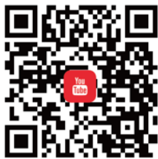
CANWF YouTube 觀看最新影音新聞、今日以色列影片