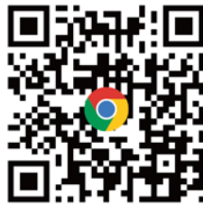
CANWF官方網站 完整資訊都在這 (可到網站下方 訂閱免費電子報)