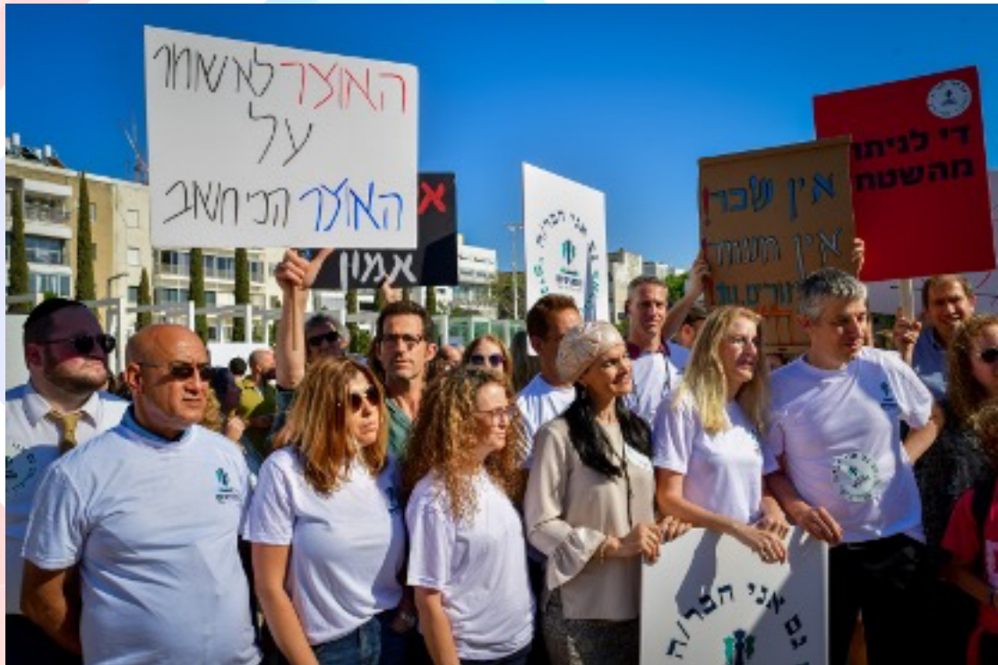
2022年5月22日，來自以色列各地的學校教師在特拉維夫進行抗議活動。

伊朗核彈正步步逼近。同樣的以色列警察首長對夏琳·阿克勒 (Shireen Abu Akleh) 在耶路撒冷的喪禮也處理得相當糟糕，儘管他們信誓旦旦宣稱，他們有能力確保耶路撒冷舊城穆斯林區在週日舉辦的「耶路撒冷日國旗遊行」 (Jerusalem Day Flag March) 不會出錯。以色列國內的貧富差距每週都在擴大。以色列住宅價格持續攀升，甚至遠超出一般民眾可以負擔的程度。教師這個職業待遇低而且教室環境不理想，長久以來無法吸引優秀人才，這些教師還威脅採取罷工行動。醫護人員在薪資待遇與條件上也是長期落後，還要遭受口頭和身體攻擊。