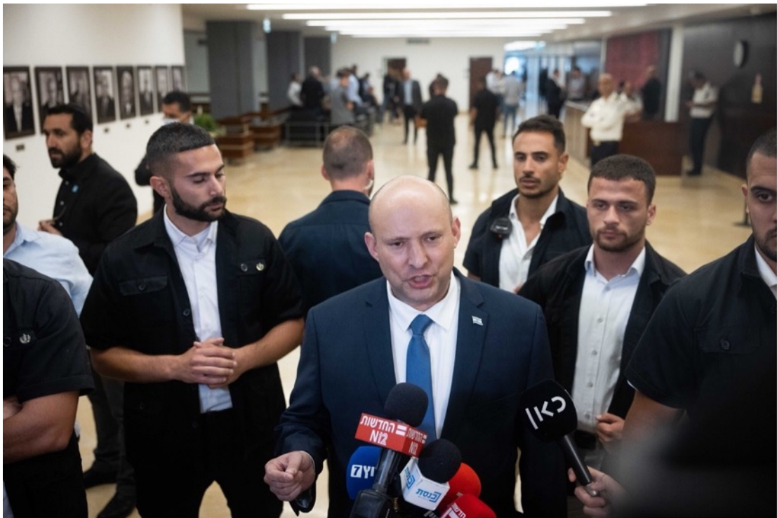
2022 年 5 月 23 日，以色列總理班奈特（Naftali Bennett）在以色列國會對媒體發表聲明。