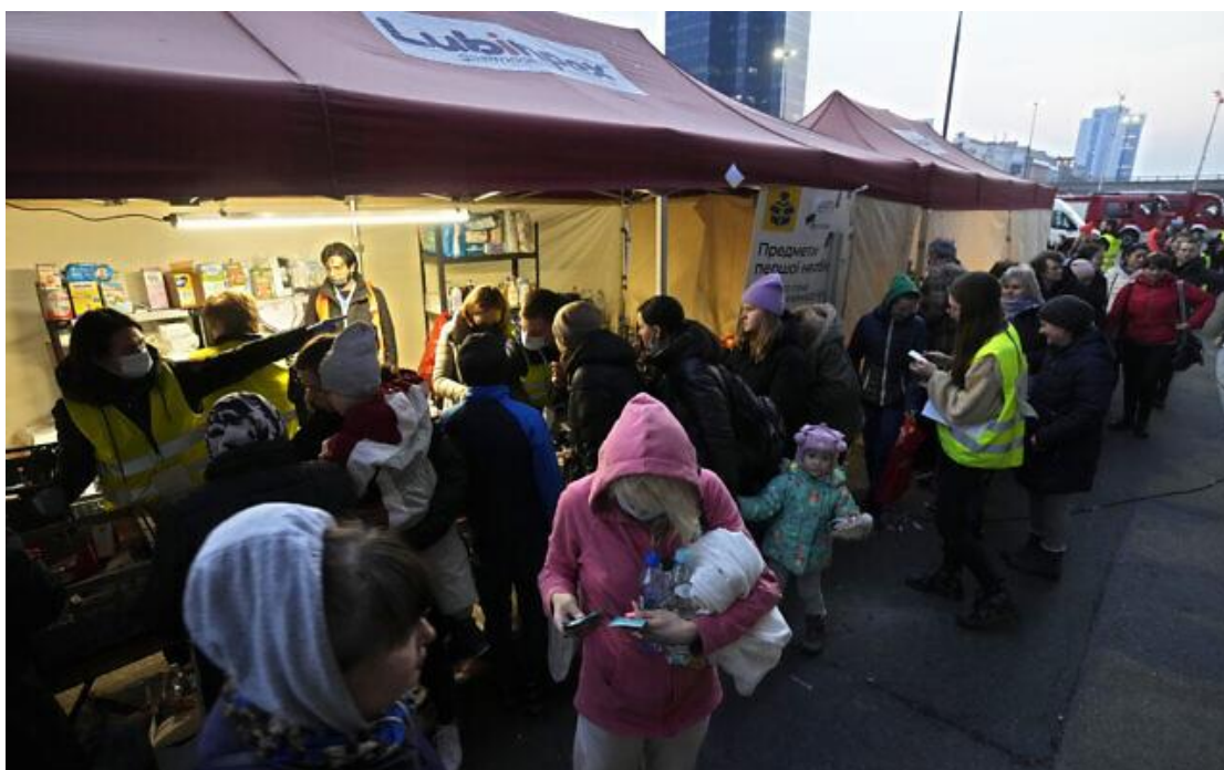
2022 年 3 月 16 日，烏克蘭難民在波蘭華沙中央車站（Warszawa Centralna）拿著捐贈的食物、衛生與嬰兒用品。