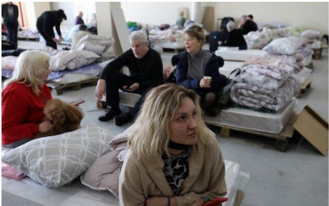
2022 年 3 月 15 日，這些逃離戰亂的烏克蘭猶太難民在摩爾多瓦首都基希涅夫的飛機棚內等候，準備去到機場，搭機前往以色列。