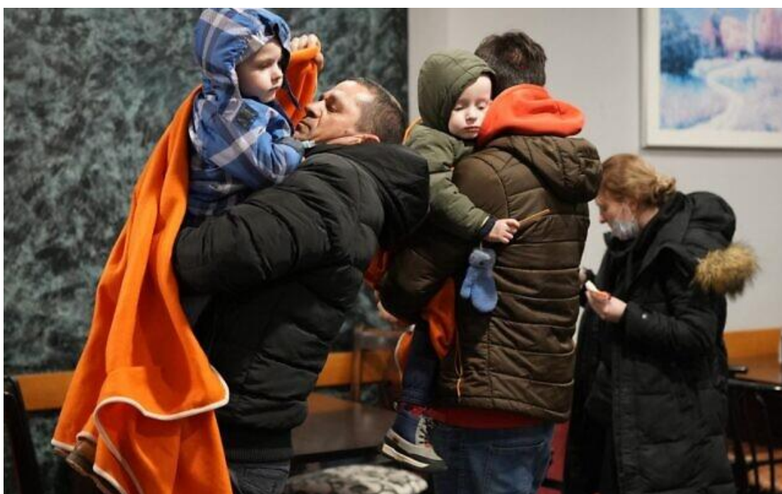
2022年3月16日，兩名計程車司機在西班牙布爾戈斯(Burgos)的路邊餐廳暫停時，一人抱著一個烏克蘭難民孩童。