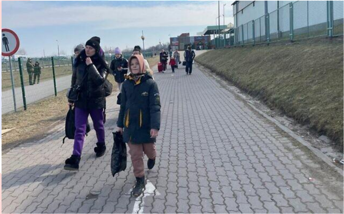
2022 年 3 月 15 日，在跨越邊境進入波蘭的米迪卡後，烏克蘭難民抵達波蘭的領土。