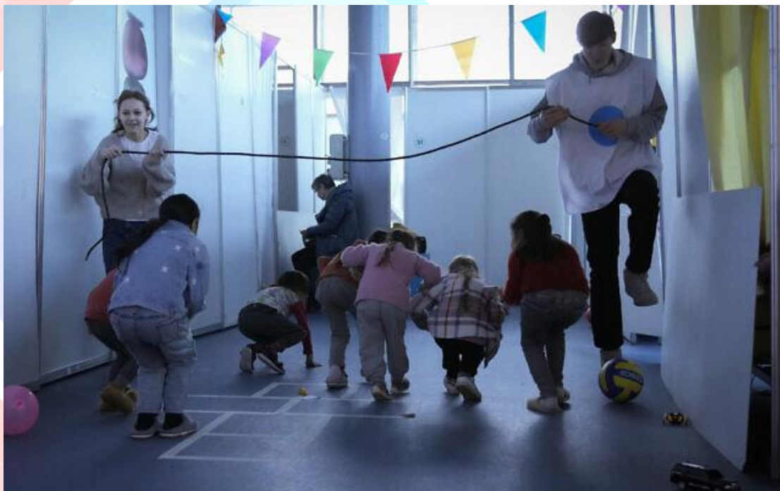
2022 年 3 月 14 日（星期一），志工在摩爾多瓦首都基希涅夫的摩爾國際展覽中心（MoldExpo National Exhibition Center）難民營內，為這些逃離戰亂的孩童安排娛樂活動。