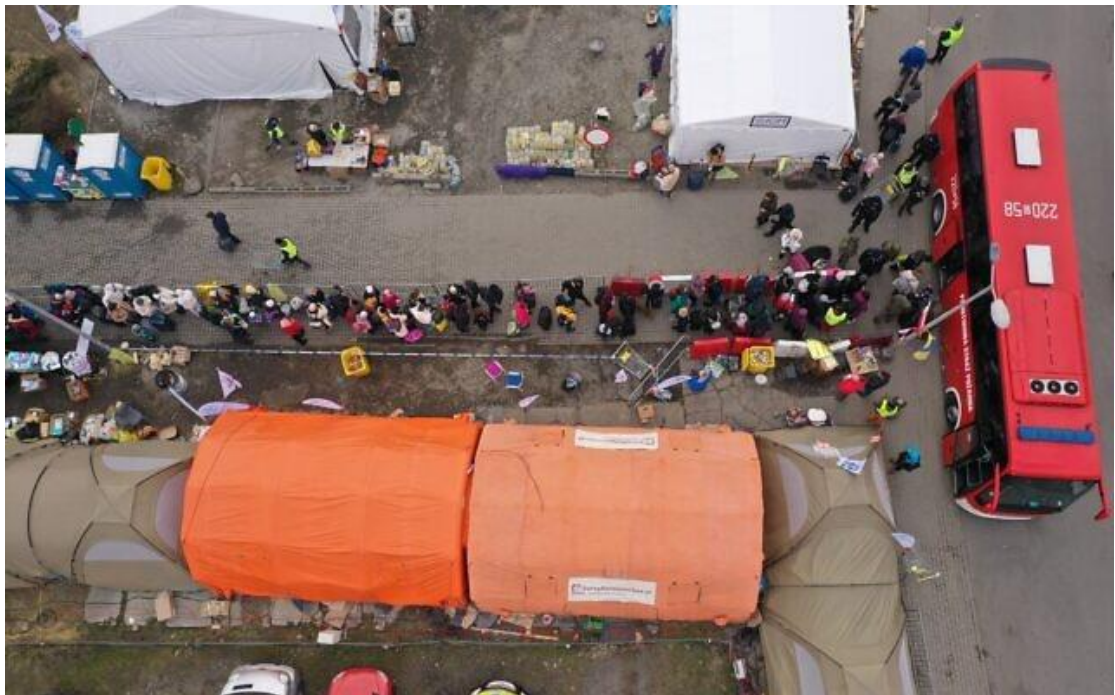
2022 年 3 月 13 日，烏克蘭難民在波蘭米迪卡邊境關卡等候交通車的空中鳥瞰圖。