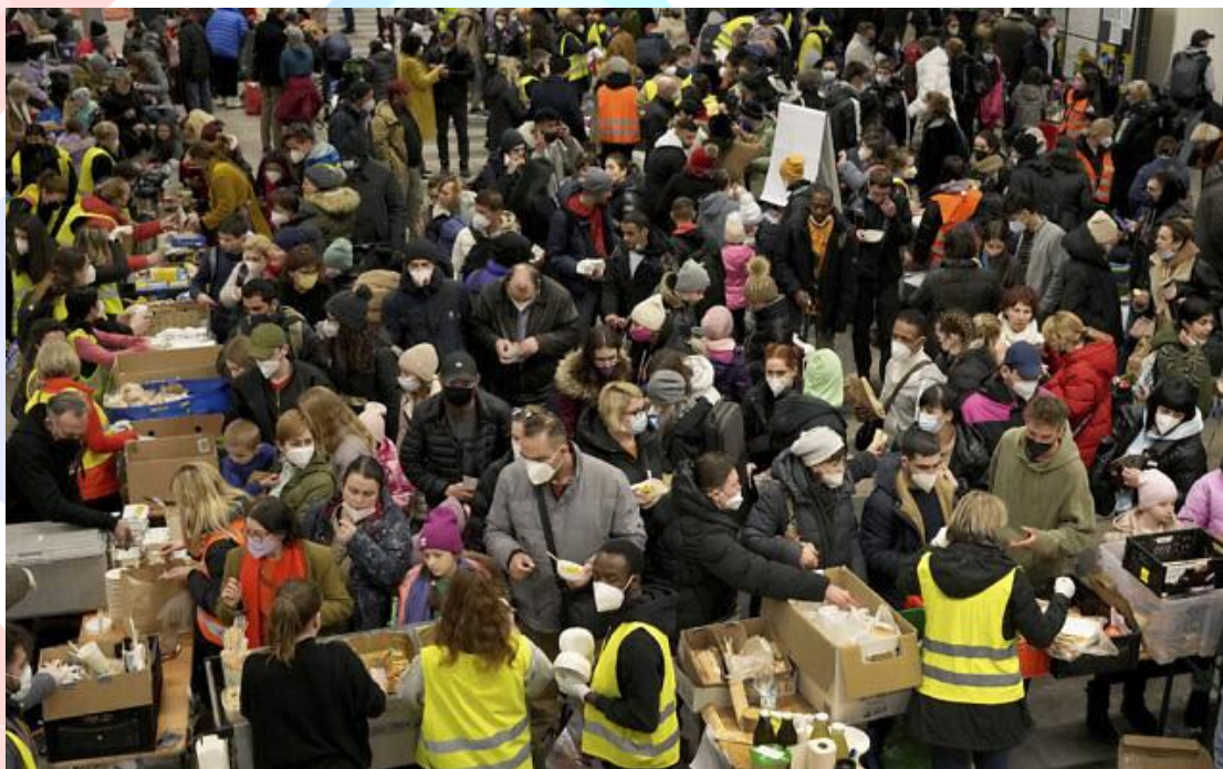
2022年3月8日，烏克蘭難民在抵達德國柏林的主要車站後，在接待區內排隊領取食物。