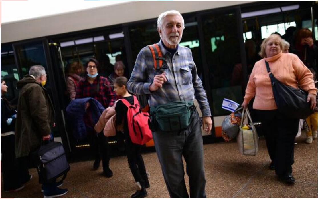
2022 年 3 月 15 日，逃離烏克蘭戰火的難民抵達特拉維夫附近的本古里安國際機場。