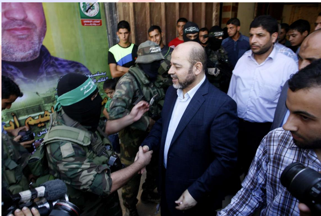
哈馬斯政治局副領導人穆薩·阿布·馬祖克（右）擁抱伊斯蘭運動時武裝聯隊埃茲丁·卡薩姆旅（Ezzedine al-Qassam）的一名成員。

聯合國也不能再保證世界的和平與安全，因為聯合國安理會及五個常任理事國（P5, five permanent members）無法再發揮他們的功用。此外阿布·馬祖克表示，聯合國很快就會結束其在全世界的工作。「而我們不能忘記猶太復國主義制度被不公平的強加在我們的土地上。」