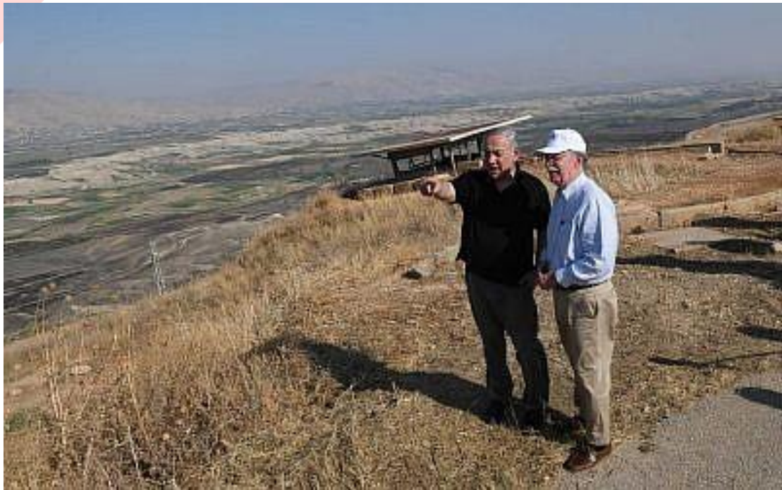
2019年6月23日，以色列總理納坦雅胡（左）與時任美國國家安全顧問波頓參觀約旦河谷。

美國前國家安全顧問波頓（John Bolton）向來支持以色列併吞約旦河西岸的計劃，並支持美國承認以色列對戈蘭高地的主權。他擔心川普的對價交易（Quid-Pro-Quo）會立下危險的先例，認為相互交易的政治（Transactional Politics）會比制定政策來的重要。