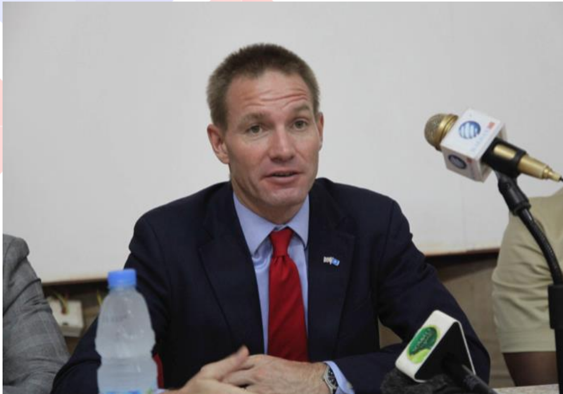
英國駐以色列大使尼爾·威根(Neil Wigan)。

此外，科學與軍事合作更是突破歷年記錄，英國皇家空軍(Royal Air Force)與以色列空軍(Israel Air Force)進行聯合訓練。英國大使相信兩國之間的科學、貿易、科技方面的合作正值歷史高點，並且持續增加。