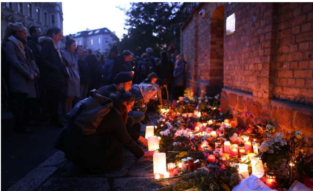
2019年10月10日，反猶槍殺事件事隔一天，哀悼者於德國東部哈勒市 (Halle) 點燃蠟燭向罹難者致敬。

「加百列」智慧安全系統能在事發第一時間通知救難人員，在緊急按鈕按下前，就能自動偵測槍響和爆炸聲。