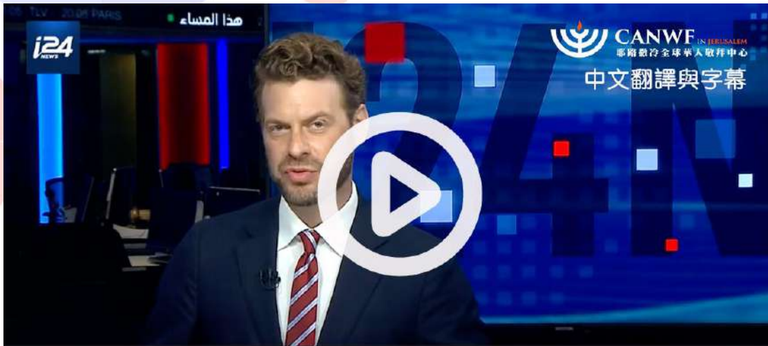
哈瑪斯武裝份子逃離加薩奔向以色列