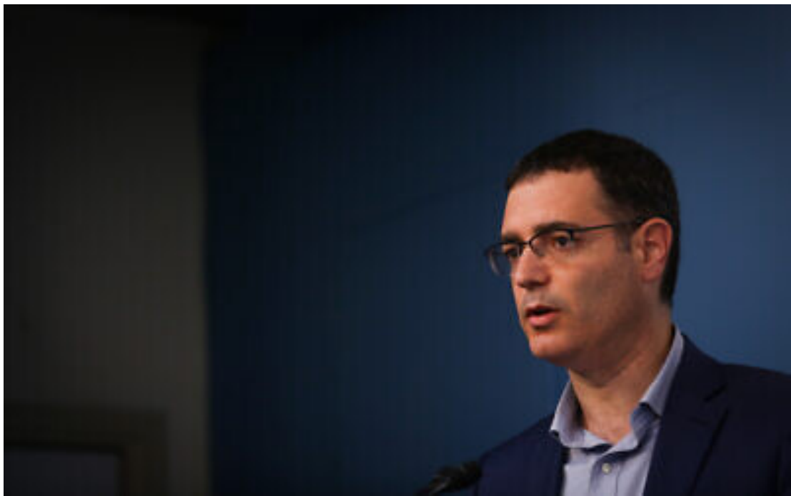
2020 年 3 月 8 日，以色列衛生部局長托夫在耶路撒冷的總理辦公室。

托夫表示：「只要每天都延後疫情爆發時間，就可以爭取到時間。」讓以色列有機會獲得所需的所有醫療物資。