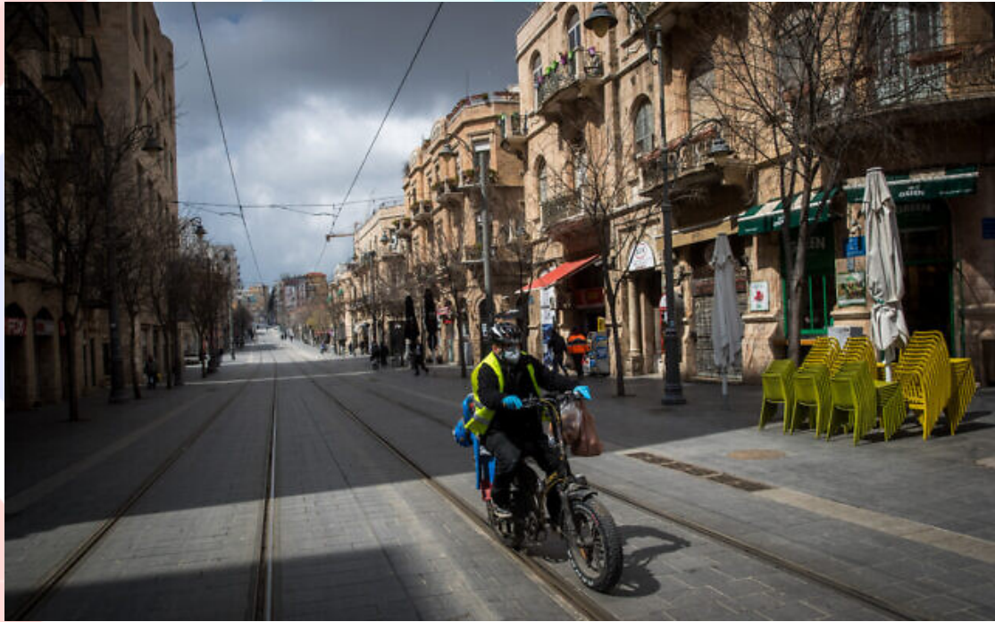
2020年3月19日，一名戴口罩的男子騎著摩托車，行駛在耶路撒冷的雅法路（Jaffa Street）上。