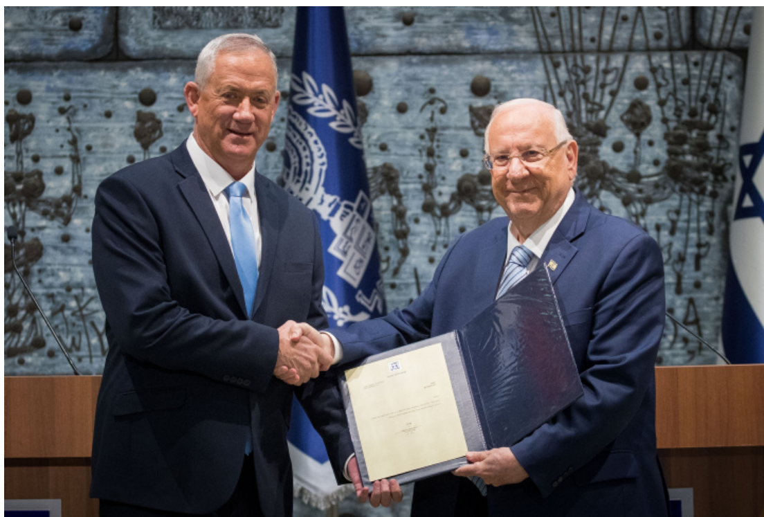
2019 年 10 月 23 日，當時甘茨獲以色列總統邀請授權組建內閣政府。

甘茨已經確定得著超過 61 席位國會議員的支持，並於 3 月 16 日經由里夫林總統正式邀請，授權在為期四週內來組建內閣政府，這是甘茨在 9 月大選後未能成立政府之後第二次接受任命；接下來，在組建內閣政府期間，席位超過 3.25% 的門檻的各個政黨，是否願意讓甘茨買單，推派部長來組建內閣，是所屬重點；而阿拉伯聯合名單政黨「政黨內有國會議員是支持恐怖份子在加薩攻擊以色列的行為，並中心思想是奪回耶路撒冷成為巴勒斯坦的首都」與以色列是我們的家園政黨，這次雙方能夠力挺甘茨，雖說不是握手，但在某個層面上能夠聯手，令部份人士感到詫異；其實，也不感意外，畢竟能夠促成他們聯手的橋樑就是：不再納坦雅胡！是的，這股仇恨與絕對，促使雙方死對頭不對盤的政黨而聯盟，共推翻納坦雅胡政權。