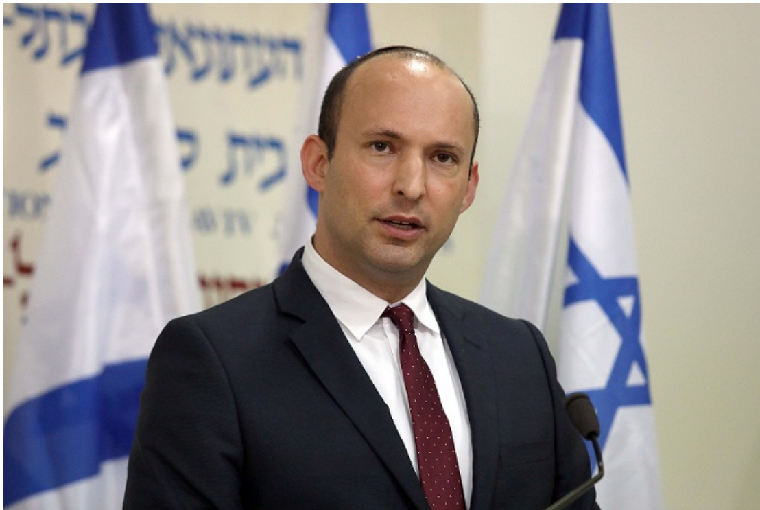
以色列國防部長拿弗他利·班奈特（Naftali Bennett）。(Credit: Israel Hayom)

週一（3/16）就在甘茨離開總統官邸後，開始與工黨、梅雷茲黨並以色列是我們的家園政黨黨魁聯絡，並與其見面商談。而當甘茨打電話給宗教政黨各黨魁以及國防部長拿弗他利·班奈特（Naftali Bennett），希望能見面商談內閣政府時，是被拒絕的；班奈特甚至呼籲甘茨加入由納坦雅胡領導的內閣政府，並表明「直到你的政黨脫離支持恐怖份子的阿拉伯聯合名單政黨，我才會見你。」而阿拉伯聯合名單政黨同時也表態，我們推薦支持甘茨組建內閣，是要一個中央左翼政府，我們絕對無法加入支持一個藍白政黨和利庫德政黨共組的聯合政府。縱使目前甘茨擁有一半以上的國會議員支持他組建內閣政府，但並不意味著甘茨能夠召集足夠的國會議員同意他的內閣政府。右翼與左翼各方彼此的對立，立場無法妥協，考驗著甘茨組建內閣的能力。