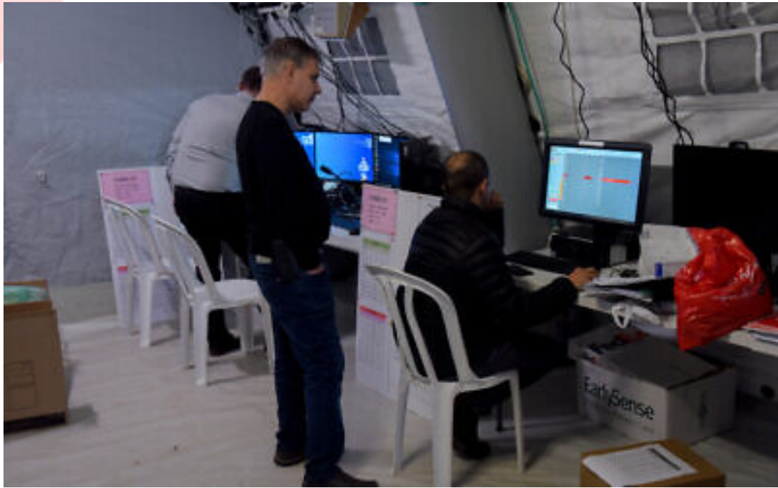
2020年2月20日，示巴醫學中心新冠狀病毒隔離區的工作人員。

該名醫師於3月2日從法國回以色列，被隔離之前還在急診室執勤，以色列政府到3月4日才宣布從法國回國的旅客需要隔離。治療像這位醫生一樣的病患是許多醫院正面臨的挑戰。