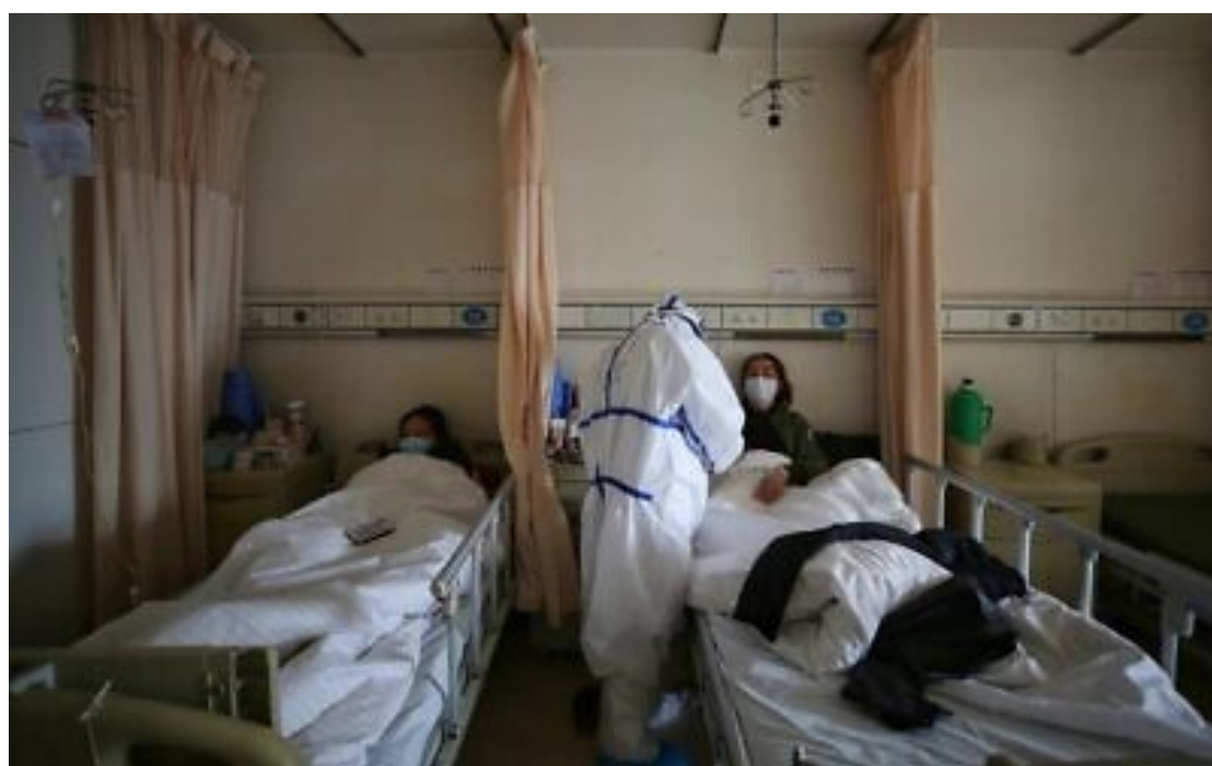
2020年3月11日，武漢紅十字醫院醫護人員治療病患。

感染專家萊瑟姆表示：「這是新加坡嘗試及實驗成功的作法，我們需要借鏡其他國家，從他們的經驗學以致用。」