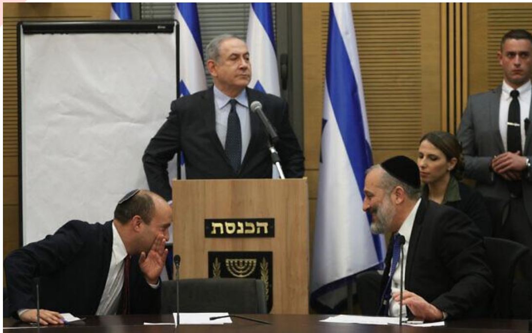
2020 年 3 月 4 日，以色列總理納坦雅胡與右翼政黨領袖們見面。

如此的政府需要向這兩方宿敵以色列是我們的家園政黨(Yisrael Beiteinu)與阿拉伯聯合名單政黨(Joint List)來聯合訴求。根據上週四(3/5)報導，以色列是我們的家園政黨主席阿維格多·利伯曼(Avigdor Liberman)表示，他願意支持這樣的政府，以徹底終結納坦雅胡招聚鷹派世俗主義者的任何可能。