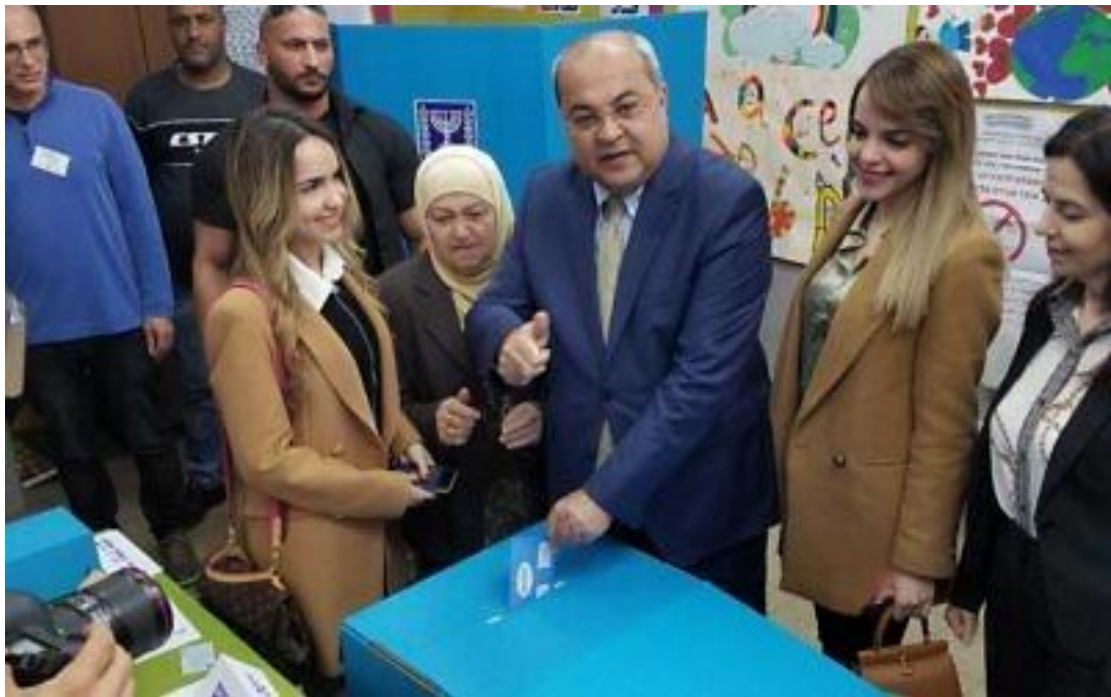
2020 年 3 月 2 日，阿拉伯聯合名單政黨國會議員阿曼德·提比（Ahmad Tibi）在家鄉 Taibe 投票。(Adam Rasgon/Times of Israel)

「我會告訴總統，我沒有取得必要多數（necessary majority），組成政府看來是失敗了，我們往前走吧。」他說。