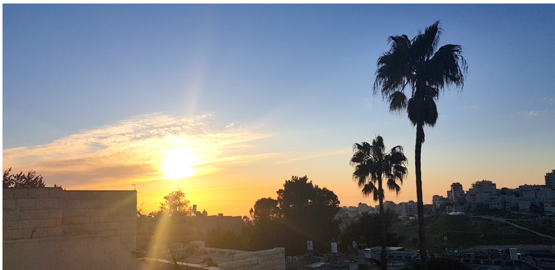
耶路撒冷全球華人敬拜中心清晨日出。

親愛的天父，我們為著 2019 年歸回 3 萬 4 千名猶太人至以色列向祢獻上感謝，這 10 年來，今年在猶太人歸回上是最高的紀錄，真為美好。猶太子民從出母腹時，便已造就成為要歸向祢的子民，並到祢這裡聚集。我們為著祢看為尊貴的以色列百姓來禱告，求祢繼續引領在海外的猶太人能夠歸回到這塊應許之地，祢在他們當中成為猶太長兄的力量與幫助，引領他們早早飽得天父的慈愛，得著祢的救恩。天父，這些年間祢帶領華人，無論在禱告和金錢的支持上，祝福以色列，使猶太百姓蒙恩，求祢繼續引領我們，特別在衣索比亞猶太人歸回事工上，成為預備道路的一份子，修築修築大道，撿去石頭，為萬民豎立大旗。深願華人站立在猶太長兄身後，歡呼我們的賞賜者、拯救者來到，我們在這被眷顧、不撇棄的城中等候彌賽亞的再來。奉主名來的是應當稱頌的，感謝讚美主。禱告奉靠耶穌基督寶貴的聖名，阿們。