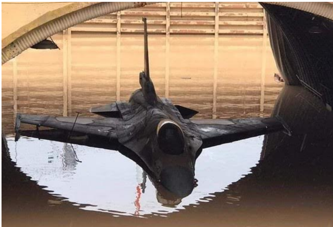
被泡水的 F-16 戰機。

其中一架 F-16 戰機浸泡在充滿雨水的機庫中，照片於星期日下午軍方同意刊出，在社群媒體上被瘋狂轉貼。