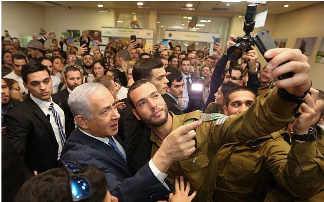
2019 年 1 月 24 日，特拉維夫一場為孤身士兵舉辦的活動中，一名士兵與納坦雅胡總理自拍。

相關內文新聞資訊：The Times Of Israel, JP, Haaretz, i24NEWS, israel today, ynetnews, shevat 7 news, Channel 12