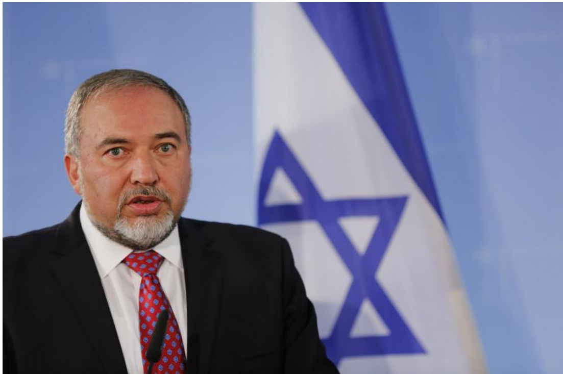
以色列家園政黨（Yisrael Beiteinu）阿維格多·李伯曼（Avigdor Liberman）。

以色列家園黨李伯曼堅決拒絕加入內閣政府因而造成破局，國會選舉重來一遍，他的立場在於要求極端正統派猶太教徒需要服兵役議案，否則拒絕加入執政聯盟，而宗教黨派想當然爾是反對該方案的。