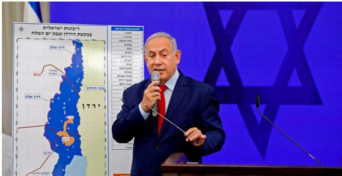
2019 年 9 月 10 日納坦雅胡總理於以色列南地亞實基倫市召開記者會。

當我們在為國會大選禱告時，你很難無視土地的問題，若不然在禱告上有可能僅是蜻蜓點水。我們看見，本週二納坦雅胡總理急忙地召開記者會，發表論述，在即將要選舉前一週，告知大家，若他當選了，就會將約旦河谷與死海北部之地重整，該是以色列主權延伸的地方，他都不會放過！從一個國家總理（君王）發出的呼聲，看起來是因為納坦雅胡向右翼選民催票，與選舉有關；實際上，神將這位君王對全球教會發出呼聲：為以色列關鍵大選禱告，這是一場相關地土之爭。記者會中，當然，納坦雅胡也表明，這些約旦河谷與死海北部的延展計畫需要與美國川普總統商談合議，畢竟全球關注在以色列大選、政局穩定之後，川普政府即將要公佈的「中東和平解決方案-世紀協議」，這些都是與土地息息相關，而土地與百姓是脫離不了關係的。