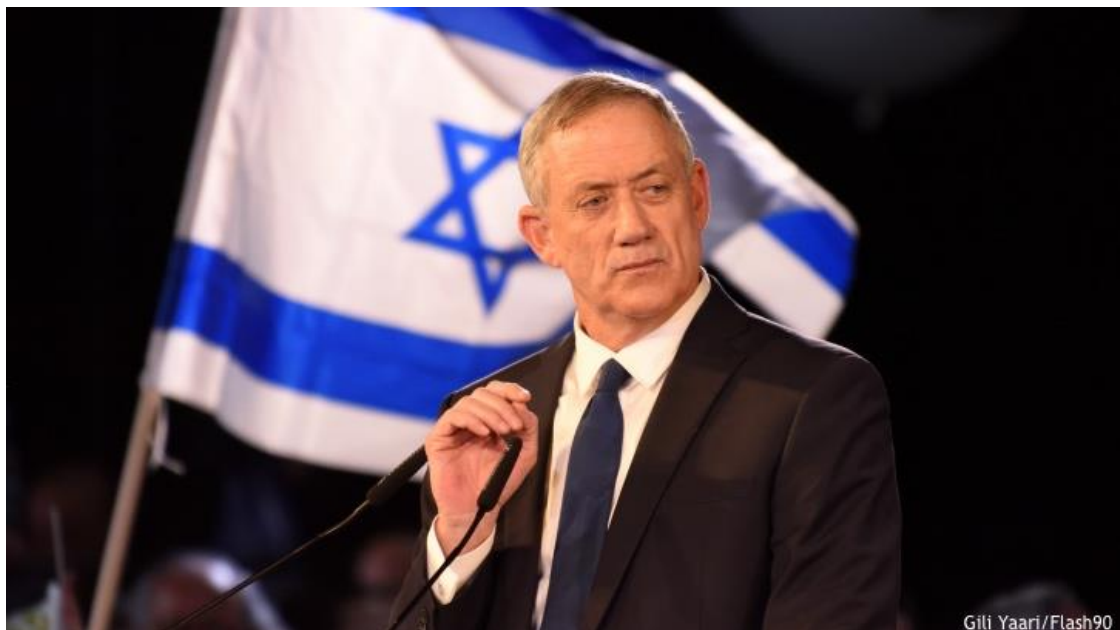
藍白政黨班尼·甘茨 (Benny Gantz)。

近年來，以色列公眾，尤其是年輕的以色列人，無可否認地向右傾斜，在社群媒體公開談論中，更是看見已經逐漸擺脫任何支持和平的語言，大家漸有共識，明白支持與巴勒斯坦和平似乎是很愚蠢的一件事，因為巴勒斯坦自治政府背後由恐怖份子法塔赫政權主治，此恐怖政權的宗旨是消滅猶太人，奪回耶路撒冷；這樣的一個政府如何知道什麼是和平？！再加上曾經在 2015 年選舉日前夕，納坦雅胡總理表示「阿拉伯選民成群結隊地出來投票」，造成猶太民眾群起亢奮起來投票的情緒，在當時曾經愈演愈烈。2013 年選舉，投票率是 67.8%，2015 年選舉高達 80%。今年(2019 年)，四月份的投票率僅 61.3%。