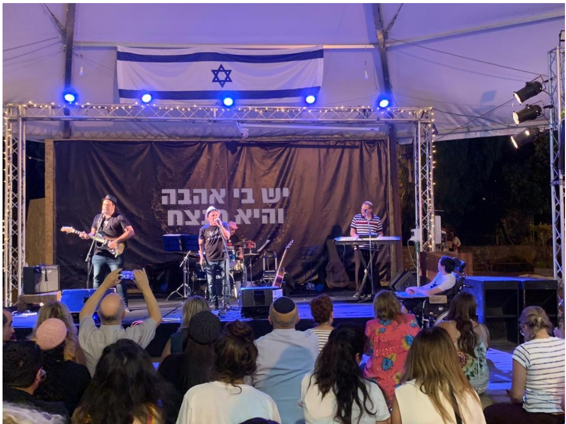
耶路撒冷第一車站(The First Station)猶太情人節活動。