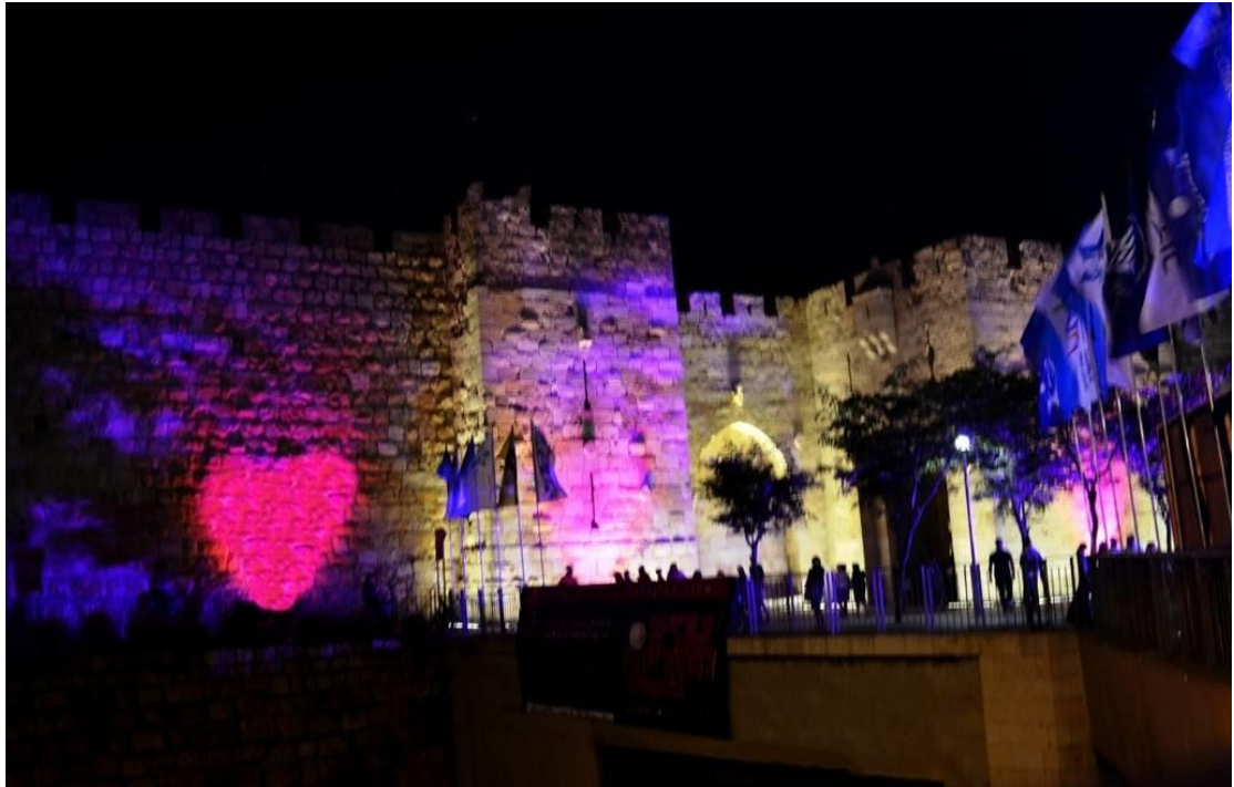
雅法門外城牆打上心形燈光，應景猶太情人節(Tu B'Av)。