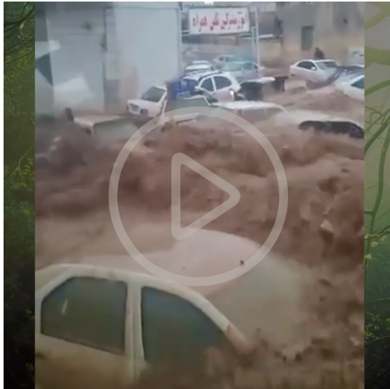
2019 年 3 月 25 日發生在伊朗設拉子(Shiraz)暴洪影片。

這是伊朗自 1940 年以來，所經歷的最為嚴重的洪澇災害，自三月中旬以來持續的大規模降雨使全國 31 個省中的 25 個不同程度受災，西部和西南部地區的災情最為嚴重。據估計，洪災已造成近 25 億美元的經濟損失。