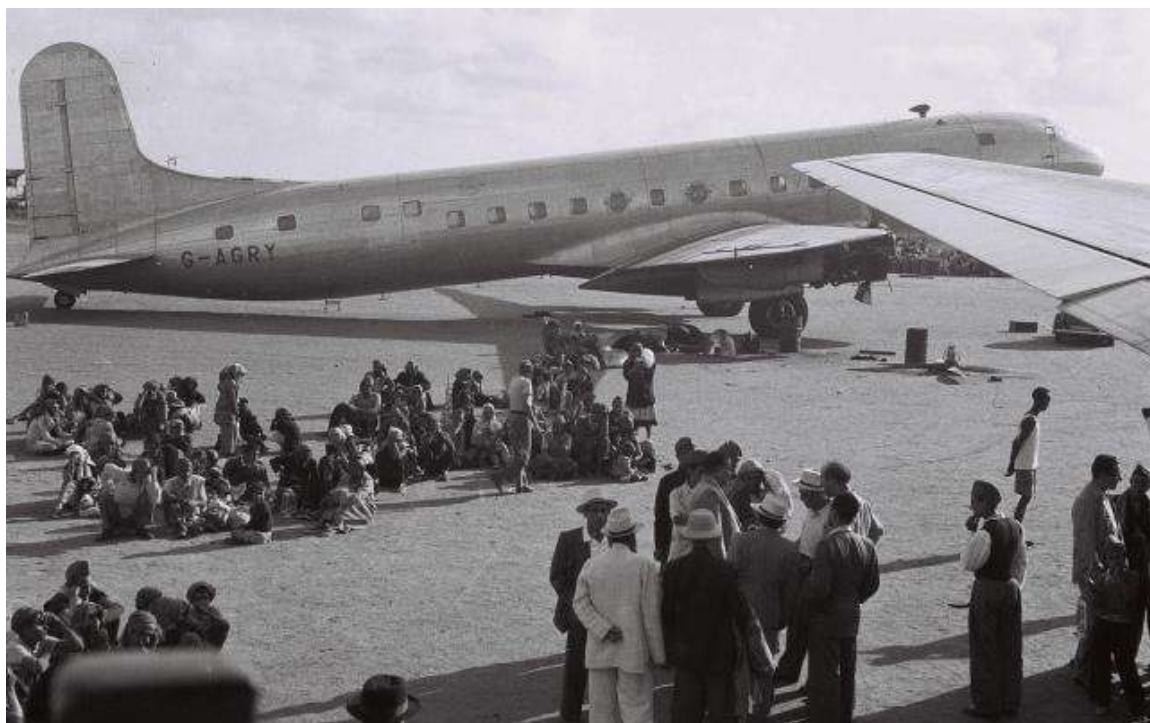
1949年11月1號，葉門亞丁市的猶太人正等待撤離前往以色列。

經過18個月的研究和釐清後，以色列先後對突 尼西亞及利比亞分別求償350億及150億美元， 為彌補被迫驅逐猶太人所損失的資產。