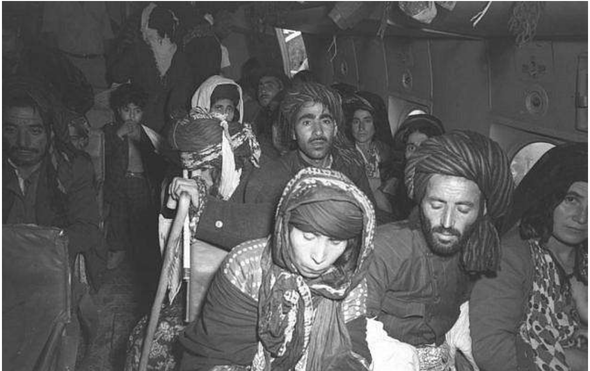
1951年夏天，伊拉克猶太人抵達以色列盧德機場(今本-古里安國際機場)。

電視新聞媒體報導，過去18個月，以色列透過國際的會計事務所默默地在計算及研究這些猶太人難民所損失的財產金額。