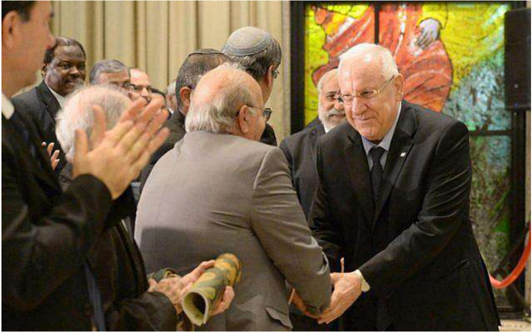
2014年11月30號，以色列魯文總統於阿拉伯猶太難民紀念典禮發表演說。

納坦雅胡總理於2014年11月30號的典禮上發表：「11月30號並不是我們隨便選擇的紀念日，他正好在聯合國巴勒斯坦分割決議的11月29號之後。這些阿拉伯國家從未承認聯合國宣示猶太人立國的決議，然而住在阿拉伯國家的這些猶太人卻被強迫驅逐出境，遠離家鄉及所擁有的財產。我們會持續地採取行動，使他們的聲音及他們應得的賠償被重視。」