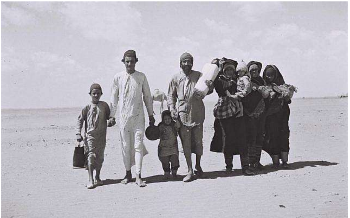
1949年，葉門猶太人前往亞丁營地，等待移民以色列。(Kluger Zoltan/Israeli National Photo Archive/public domain)

根據以色列新聞台1/5週六晚間報導，以色列求償國家共有8個，其中先對突尼西亞及利比亞分別求償350億及150億美元。以色列對上述兩個國家再加上摩洛哥、伊拉克、敘利亞、埃及、葉門和伊朗的求償金額總共超過2500億美元。