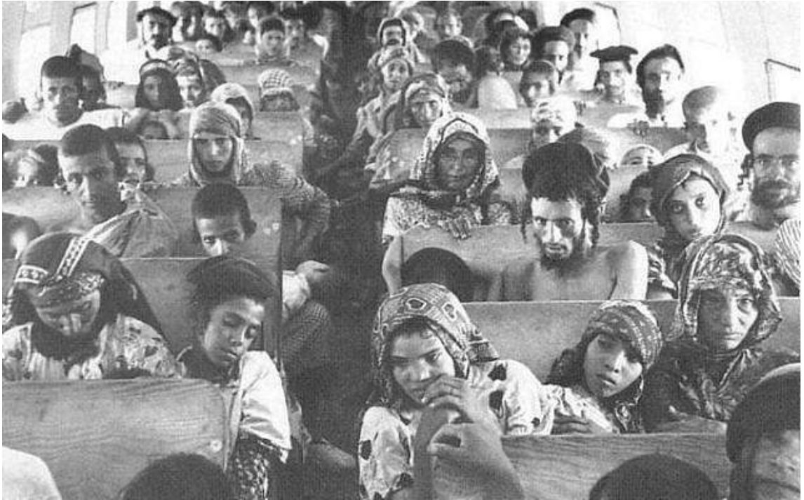
1949年，葉門猶太人於「魔毯行動」飛往以色列。

與納坦雅胡總理同樣隸屬於利庫黨的姬拉·嘉里爾 (Gila Gamliel) 再表示：「我們不能忽視那些在暴力的威脅下被迫離開中東家園的猶太人。這些猶太社群所遭受的迫害，需要被看見。」