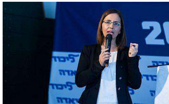
以色列社會平等部長姬拉·嘉里爾 (Gila Gamliel)

巴勒斯坦政府亦向以色列求償1000億美元的補償金，為彌補於以色列建國期間被迫離開及拋棄財產的阿拉伯人，他們已於10年前呈現該事件所造成的影響等相關資料給美國政府。