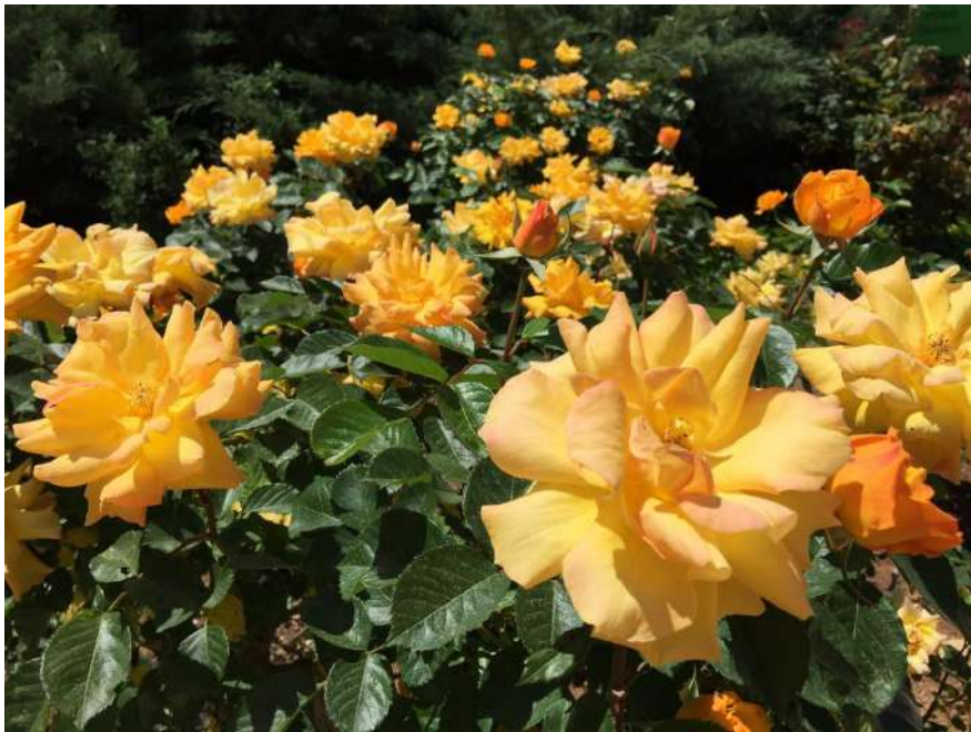
拍攝於耶路撒冷。

親愛天父，我們為著這所以色列高中向祢獻上感謝，這些寶貴的學生正在領受著弟兄和睦同居的善與美，祢看顧著他們，為著這些學生們有機會聽聞福音禱告，國際學生進入有機會將福音帶入。父神，我們為著猶太人彌賽亞信徒教會與阿拉伯基督徒教會兩造的主內家人們有更深的合一來禱告仰望祢，祢祝福使用他們帶出社會的影響力，成為百夫長、千夫長，這些年間教導他們使用快齒打量的新器具，依恃著耶穌基督這更美之約而站立，恢復在神國的身份，父神，教導我們如何捕魚，帶領更多魚群回家；新婦教會們所做的得蒙祢的悅納。禱告奉靠主耶穌聖名，阿們。